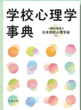
学校心理学事典: 丸善出版