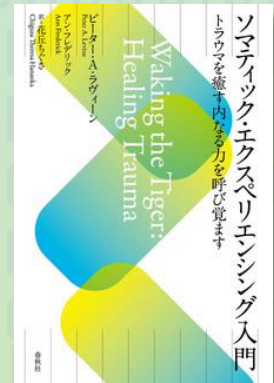
ソマティック・エクスペリエンス入門: 春秋社