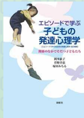
エピソードで学ぶ子どもの発達心理学: 新曜社