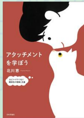
アタッチメントを学ぼう: 日本評論社