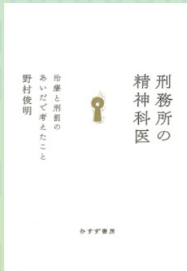
刑務所の精神科医: みすず書房