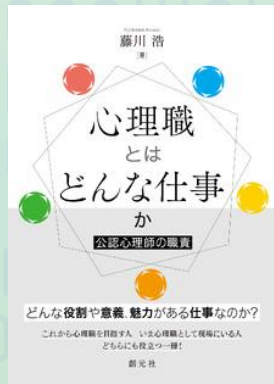
心理職とはどんな仕事か: 創元社