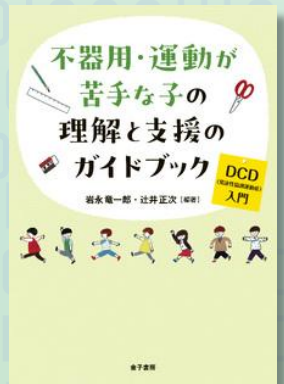
不器用・運動が苦手な子の理解と支援のガイドブック: 金子書房