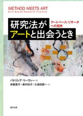
研究法がアートと出会うとき: 福村出版