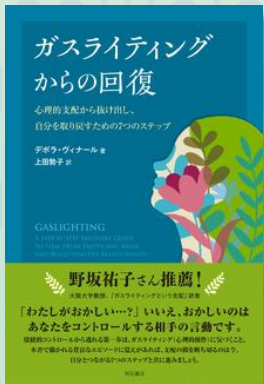
ガスライティングからの回復: 明石書店