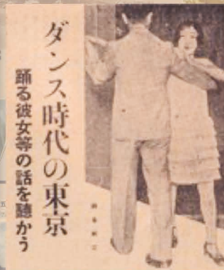
踊る彼女等の話を聴かう