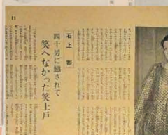
流線形恋愛レビュー（松竹少女歌劇）