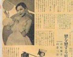
皇軍慰問會大藝演