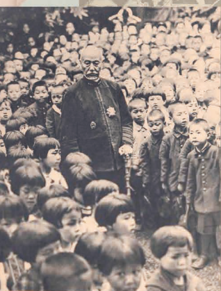
在りし日の東郷元帥