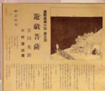
連載長編小説／吉川英治・小村雪岱