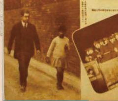
時事（皇室・国際他）