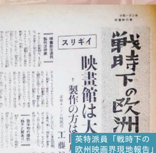
英特派員「戦時下の欧州映画界現地報告」

1922年（大正11年）に週刊朝日と並んで日本で最初に創刊された総合週刊誌のひとつ。芸能・文化・政治・経済・社会情勢の分析や鋭く切り込んだスクープ記事など、時代を投影する写真や記事が掲載されている。