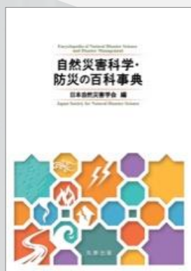
自然災害科学・防災の百科事典 (丸善出版) KP00059184