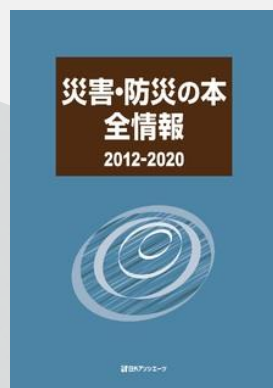
災害・防災の本全情報 2012-2020 (日外アソシエーツ) KP00041278