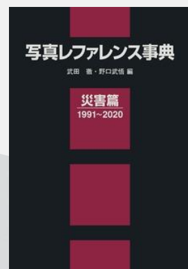
写真レファレンス事典 災害篇 (日外アソシエーツ) KP00045694