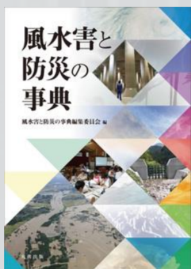
風水害と防災の事典 (丸善出版) KP00065862