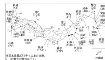
図 14-2 主な漁港の水揚げ量(2020年)

量全体の8割(貝類等を除く)まで拡大するほか、船舶等ごとに漁獲割り当てを決めて、早い着飾りによる乱獲を防ぐ。このほか、漁業権等の海面利用制度を見直して一層の有効活用を図るほか、密漁の取り締まり