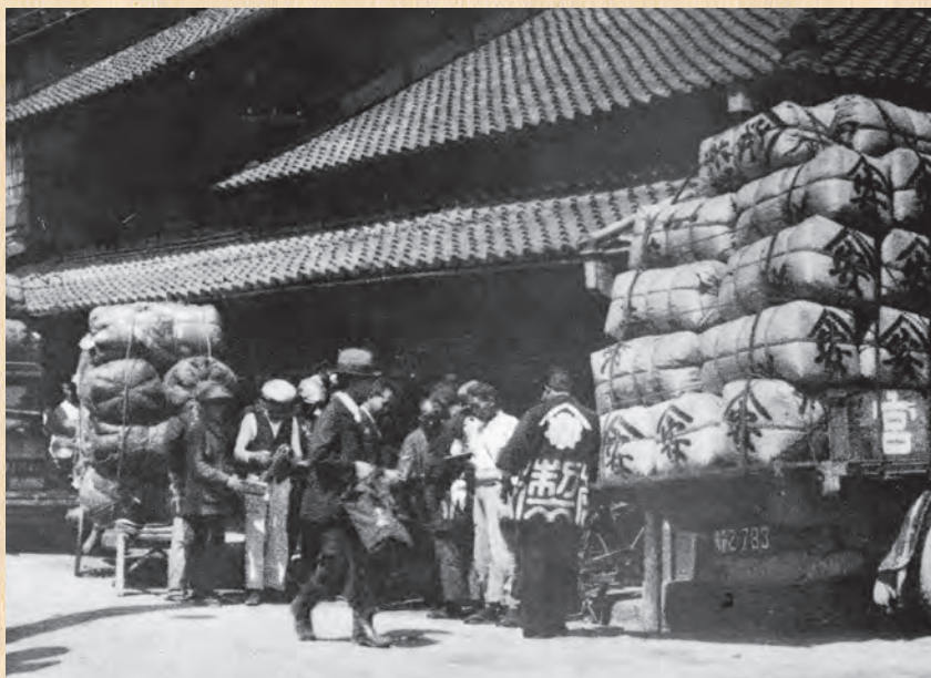
▲静岡製茶幹旋所（昭和8年頃）