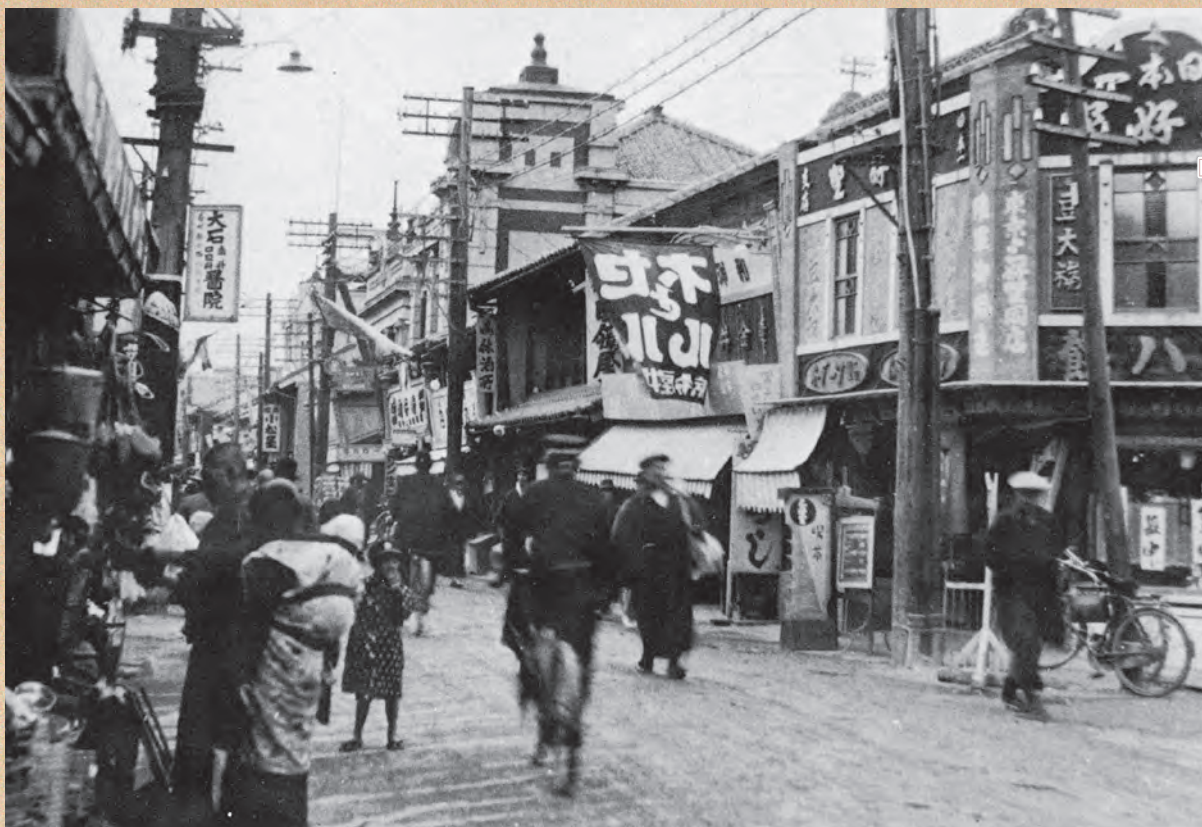
▲大正年代冬の鍛冶町通り（大正末年）