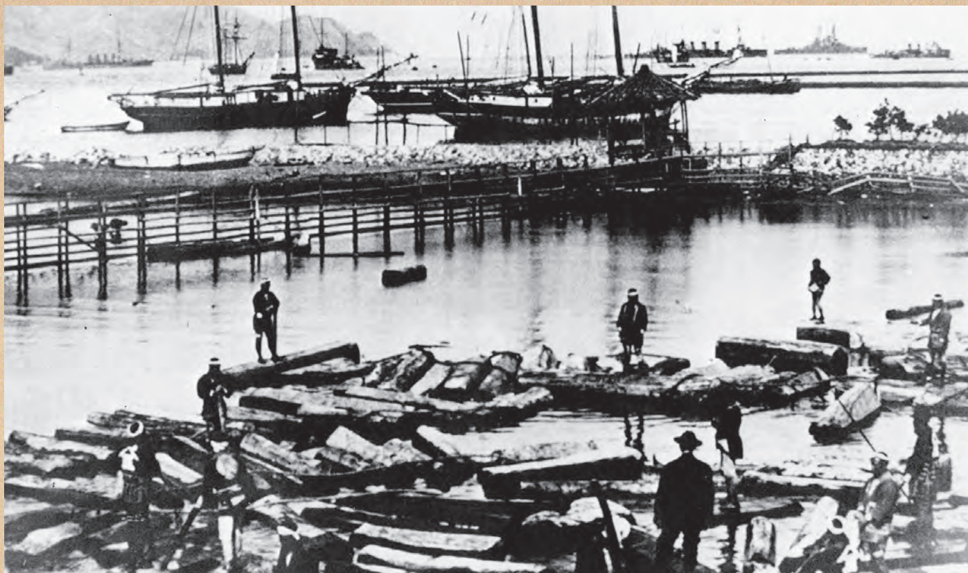
▲築港前の清水港（大正7年頃）