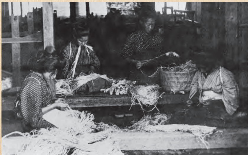
▲掛川特産葛布（大正年間）

明治から昭和初期の静岡県内旧12市町村の 貴重な写真資料を各巻200点前後収録。