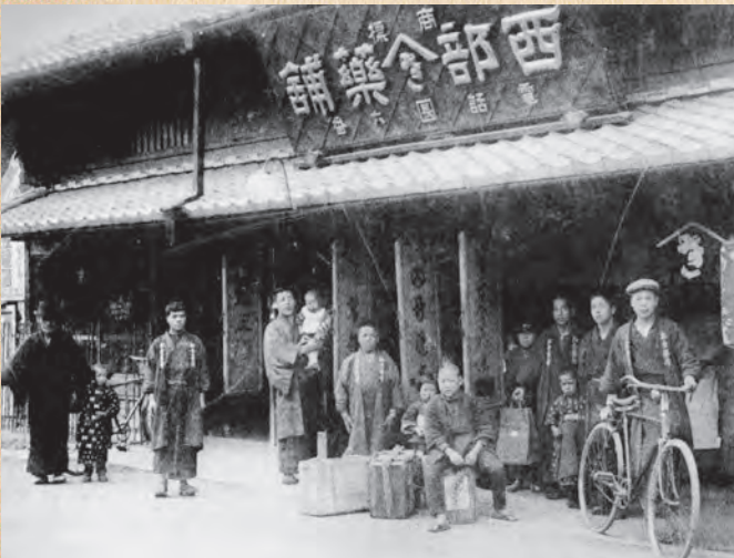
▲西部薬舖（明治末年）

国書刊行会 〒174-0056 東京都板橋区志村1-13-15 TEL: 03-5970-7421 FAX: 03-5970-7427 E-MAIL: info@kokusho.co.jp