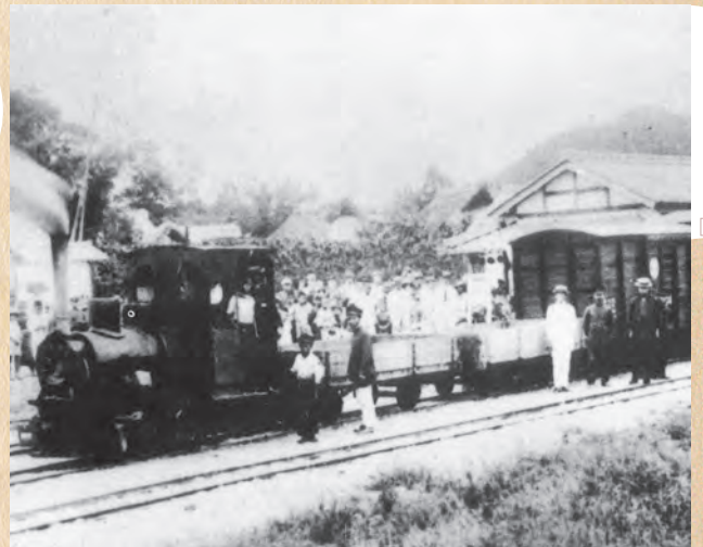
▲東濃鉄道の開通（大正7年）