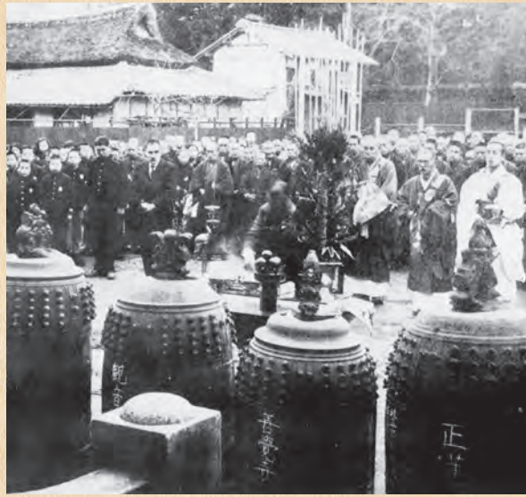
▲梵鐘の供出（昭和18年）