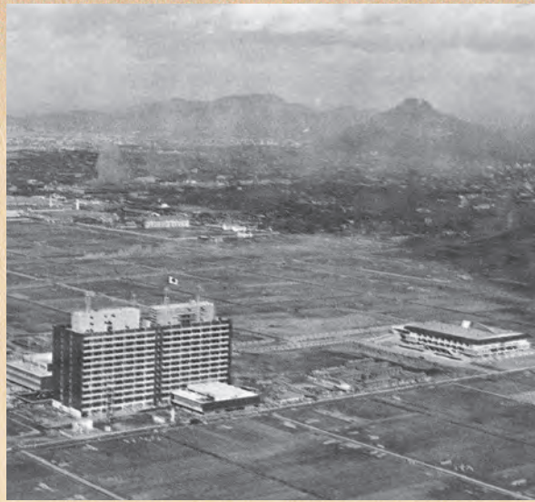
▲田んぼの中の新県庁（昭和41年）