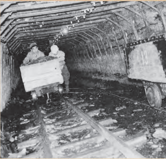
▲興和炭坑の坑内（昭和35年頃）