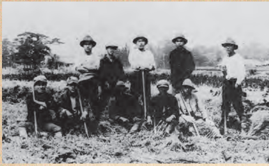
▲野田の青年たち (昭和5年頃)