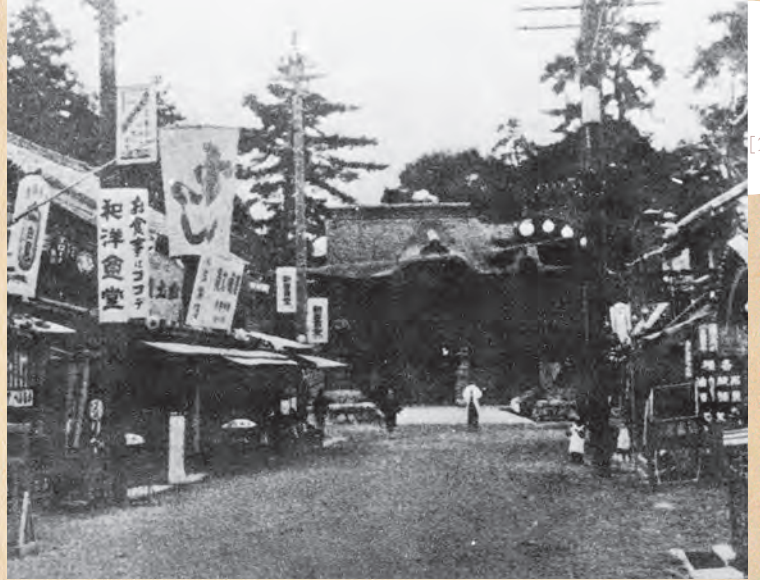
▲豊川稲荷門前 (大正末年)