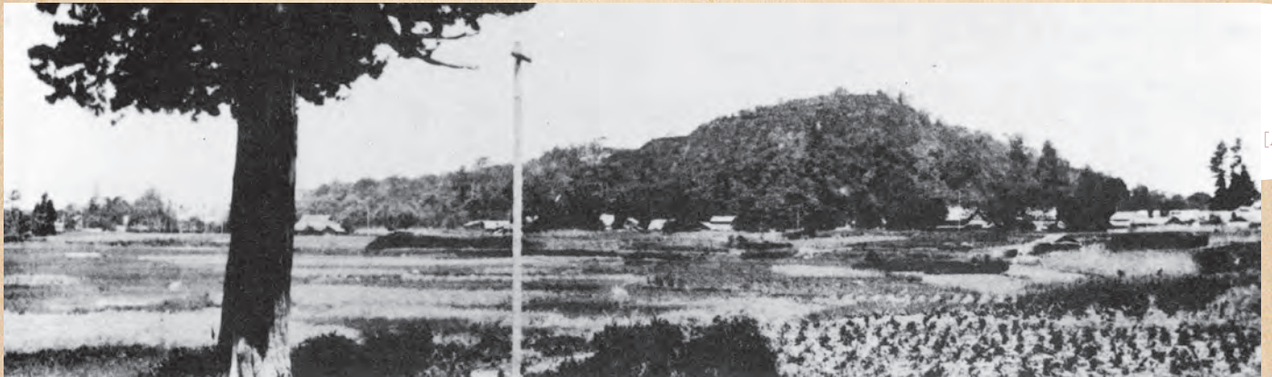
▲小牧御殿より望む小牧山 (大正年間)