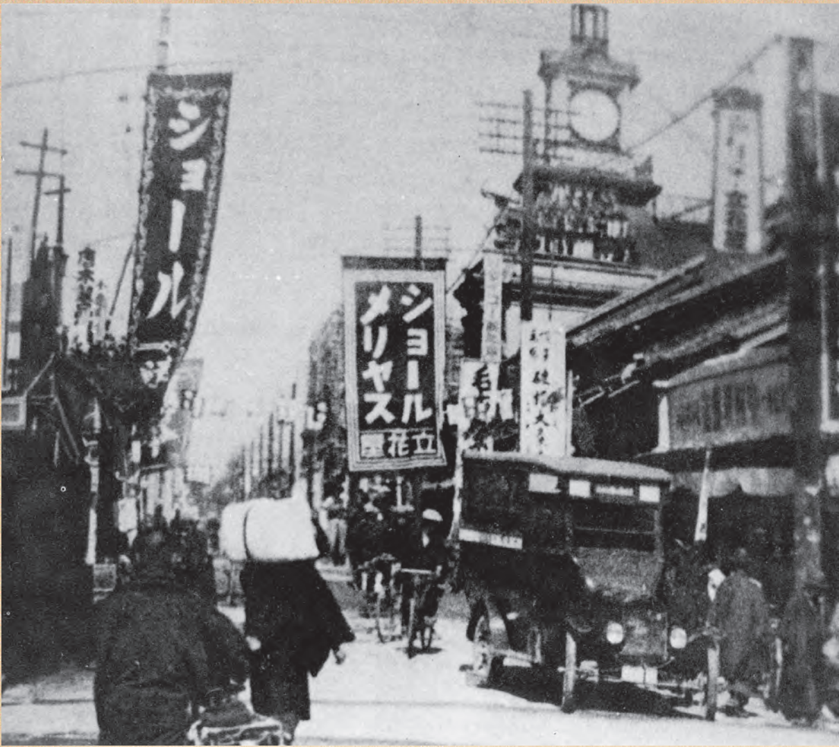
▲本町通り玉屋町のにぎわい (昭和初期)