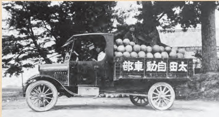
▲スイカ出荷 (昭和3年頃)