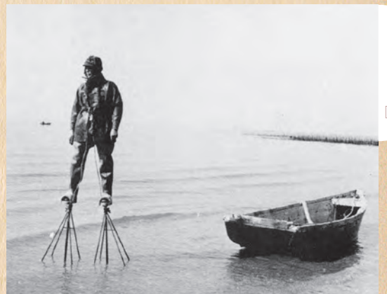
▲海苔摘みの服装 (昭和30年頃)