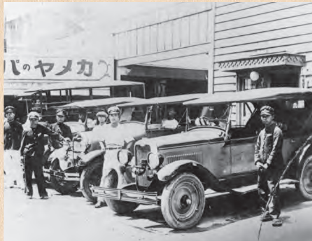
▲熊野自動車会社（昭和5年）