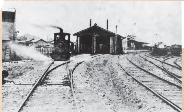
▲有田鉄道湯浅駅（大正期）

国書刊行会 〒174-0056 東京都板橋区志村1-13-15 TEL: 03-5970-7421 FAX: 03-5970-7427 E-MAIL: info@kokusho.co.jp