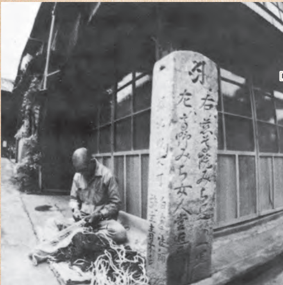
▲学文路道標（昭和30年頃）