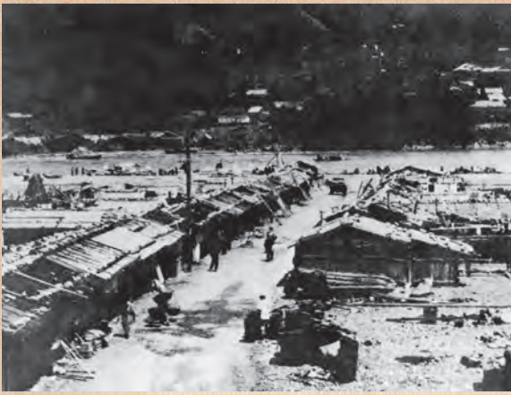
▲新宮川原町（大正9年）