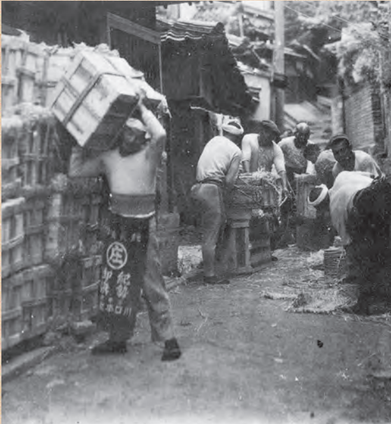
▲漆器製品の発送（昭和初年）