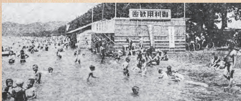
▲松原水泳場（昭和16年頃）

国書刊行会 〒174-0056 東京都板橋区志村1-13-15 TEL: 03-5970-7421 FAX: 03-5970-7427 E-MAIL: info@kokusho.co.jp