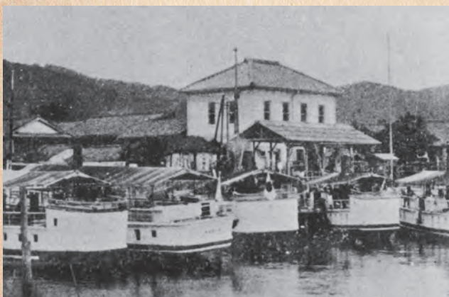
▲湖南汽船本社（明治20年頃）