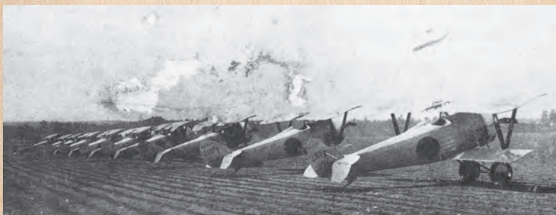
▲甲式三型戦闘機整列（昭和初年）