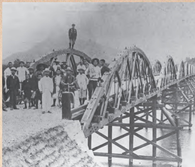
▲竣工した以久田橋（明治42年）