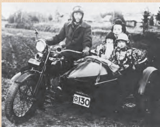
▲側車付自動二輪（昭和3年）