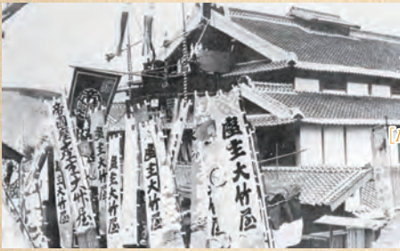
帝国座のこけら落し (大正7年)