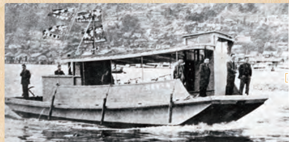
向島渡船 (昭和初期)