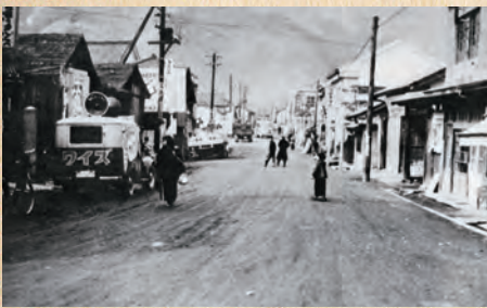
東から見た府中駅前通り 昭和28年頃

国書刊行会 〒174-0056 東京都板橋区志村1-13-15 TEL: 03-5970-7421 FAX: 03-5970-7427 E-MAIL: info@kokusho.co.jp