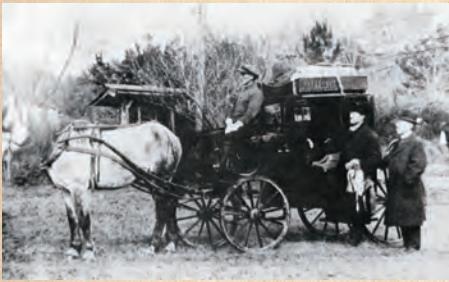
七塚原種牛牧場場長専用馬車 明治後期