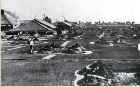
竹原塩田 (昭和10年頃)