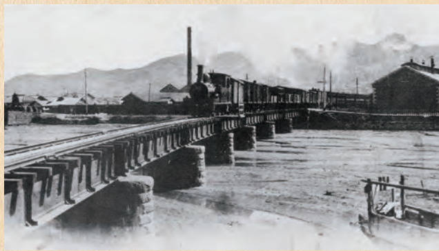
二河鉄橋上の汽車 (明治42年)