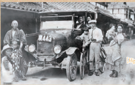
乗合自動車 (大正8年)