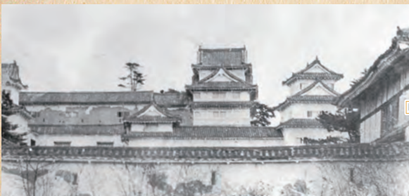
福山城 (明治維新頃)