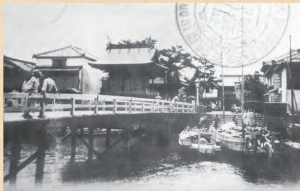
伊万里焼積荷の 乗船場（明治末年）