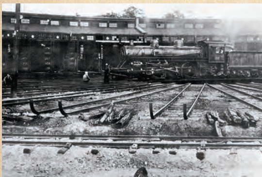
大正時代の鳥栖機関区 東車庫（大正初年）