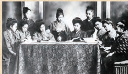
佐高女の寄宿舎生 （大正2年）