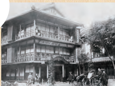
温泉通りの街並み （大正初年）

国書刊行会 〒174-0056 東京都板橋区志村1-13-15 TEL: 03-5970-7421 FAX: 03-5970-7427 E-MAIL: info@kokusho.co.jp