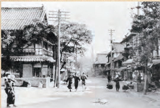
東京屋旅館 （大正5年頃）