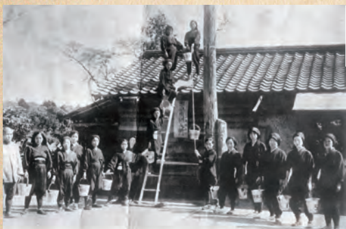
曾根崎隣保班の消火訓練 （昭和16年頃）