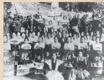
波多津の女すもう （大正11年）